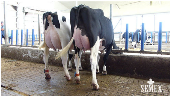
DARCROFT A F I PERRY AND PLATOON